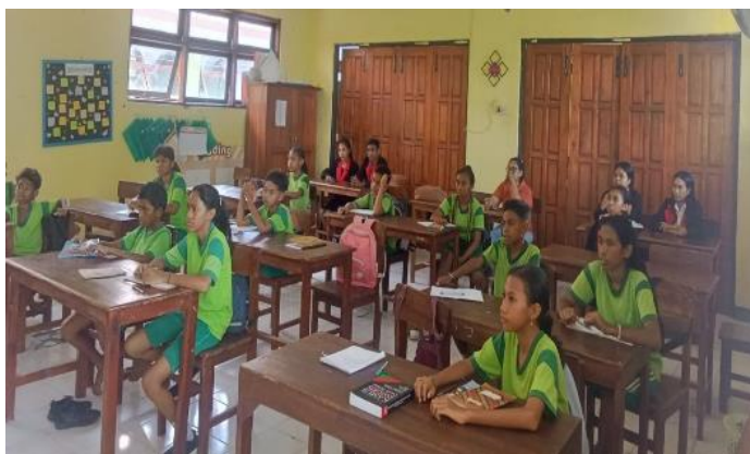
Gambar 2. Siswa SD Negeri Oesapa Kecil 2